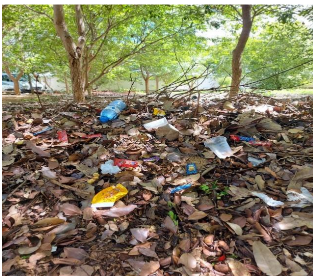
Figura 1 – Vista da área selecionada para o desenvolvimento do projeto, evidenciando o descarte inadequado lixo

O projeto está sendo executado no Instituto Federal de Educação, Ciência e Tecnologia Baiano – Campus Bom Jesus da Lapa , que conta atualmente com 625 alunos entre cursos médios integrados, subsequentes e superior. A área selecionada para desenvolvimento é uma área foco de lixo proveniente da cantina, aberta, sem pavimentação e com cobertura arbórea (Figura 1).